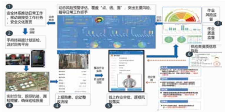
HSE业务管理平台业务场景实现图

通过危险源管理模块，可以实现五部分内容：危险源管理、危险源备案核销、危险源评估登记、危险源报警等级管理、危险源风险统计。围绕危险源，开展危险源管理活动，提供危险源基础信息录入维护，结合GIS地图，可供用户在地图上进行危险源标注，形成厂区危险源监控专题图。