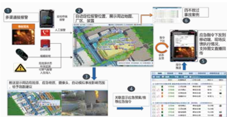
应急联动与演练平台业务场景实现图

应急联动针对化工企业、园区的各类突发事件、报警等实现统一部署，协同指挥，快速响应，把危害控制到最低。主要包括应急行动、应急态势、应急指挥三部分内容，结合厂区GIS、视频等物联网技术，实时展示、跟踪现场的处置情况和事件周边信息，实现辅助决策、协同指挥。应急演练系统通过对实际灾害现场和灾害过程的模拟仿真形成演练脚本，为用户在计算机系统或移动终端上提供各项应急救援任务指令。