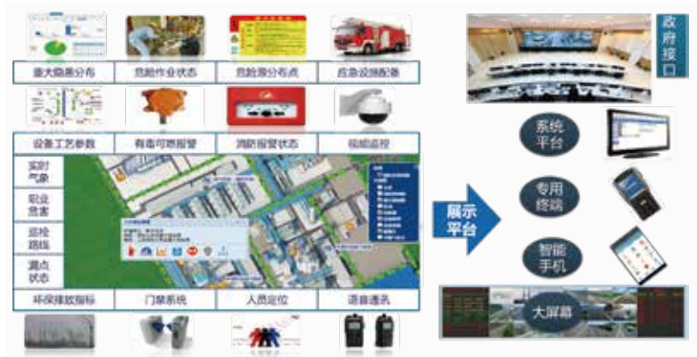
综合HSE监控平台业务场景实现图

综合HSE监控平台是基于GIS、视频监控等技术的企业综合监控平台。此平台作为企业信息可视化的集中展示窗口，对企业所有相关模块进行统一集成和数据信息展示。企业相关负责人可以24小时对当前各系统状态进行实时监控和运维管理，为企业的全局运营带来便利。